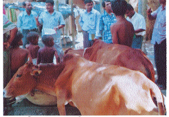
উপজেলা পশু সম্পদ কর্মকর্তাসহ অন্যান্য অংশগ্রহণকারীগণ উপকারভোগীর সাথে কর্মসূচী সংক্রান্ত বিভিন্ন প্রশ্ন করছে।