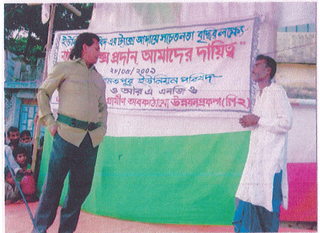
Artist of the theater group are presented their acting.