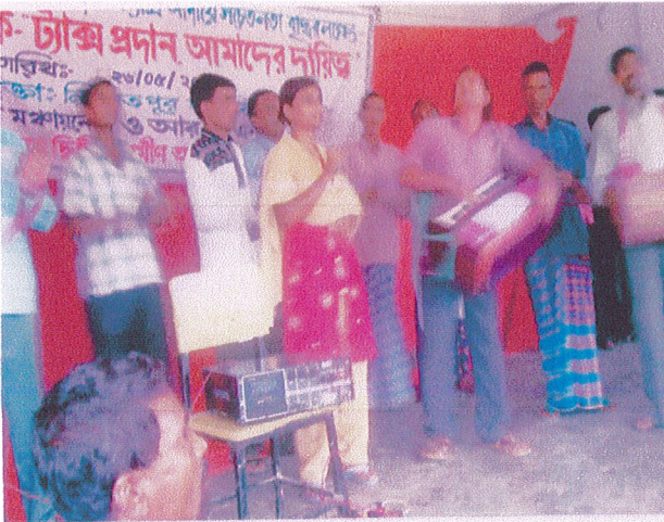
Artist of the theater group of KDS Silphi Gusti.