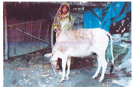
ওআরএ ঋন কর্মসূচীর আওতায় ঋন গ্রহণকারী তার গাভীর পরিচর্যা ব্যবস্থা।