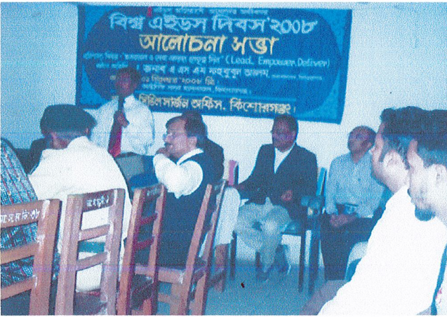
ওআরএ কিশোরগঞ্জ DIC কর্তৃক আয়োজিত জেলা কালেকটরেট ভবনে অনুষ্ঠিত বিশ্ব * দিবসের আলোচনা অনুষ্ঠানে বক্তব্য রাখছেন কিশোরগঞ্জ জেলার মাননীয় জেলা প্রশাসক।