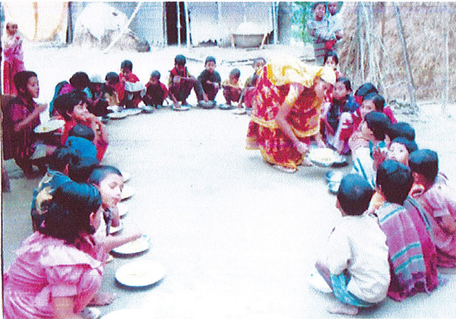
মা ও শিশু স্বাস্থ্য পুষ্টি কর্মসূচীর শিক্ষা সেশন শেষে শিশুদের মাঝে পুষ্টিকর খাবার পরিবেশন করছেন কর্মসূচীর বলান্টিয়ার।