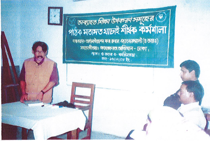
শিক্ষার মান উন্নয়নে পাঠক মতামত যাচাই অনুষ্ঠানে বক্তব্য রাখছেন গনস্বাক্ষরতা অভিযানের প্রতিনিধি।