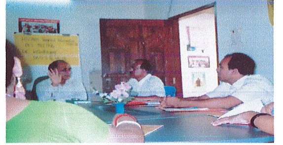
HIV / AIDS Targeted Intervention প্রকল্পের ওআরএ কিশোরগঞ্জ ডিআইসি কর্তৃক আয়োজিত প্রজেক্ট ফ্যাসিলিটেশন মিটিং এ বক্তব্য রাখছেন প্রজেক্ট ফ্যাসিলিটেশন টিমের সভাপতি কিশোরগঞ্জ জেলার মাননীয় সিভিল সার্জন।