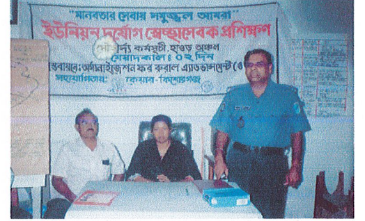
ইউনিয়ন দুর্যোগ সেচ্ছা সেবকদের দুই দিনের প্রশিক্ষণ সমাপনী অনুষ্ঠানে বক্তব্য রাখছেন করিমগঞ্জ উপজেলার মাননীয় ভারপ্রাপ্ত কর্মকর্তা এবং প্রধান অতিথি হিসেবে উপস্থিত আছেন সহকারী কমিশনার (ভূমি), করিমগঞ্জ।