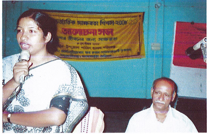
আন্তর্জাতিক স্বাক্ষরতা দিবসের আলোচনা অনুষ্ঠানে বক্তব্য রাখছেন করিমগঞ্জ উপজেলার মাননীয় সহকারী কমিশনার ভূমি।